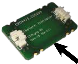
Tape på undersiden

Placeres på steder, hvor fugt kan opstå og ønskes påvist.