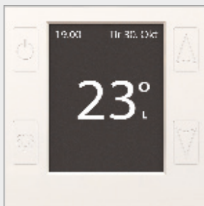
mTouch® One Front M-HV, OP