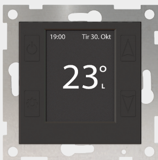
mTouch® One 1P SV, OP