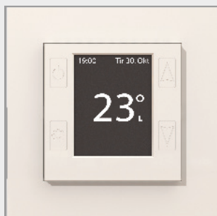
mTouch® One 1P PH