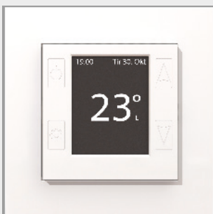
mTouch® One HV