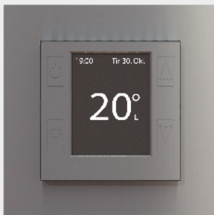
mTouch® One Alu