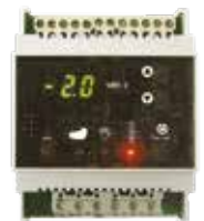
SMC2 El.nr.: 5450363