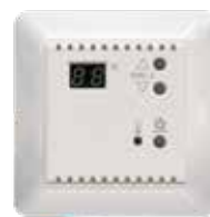
SMC1 El.nr.: 5450365