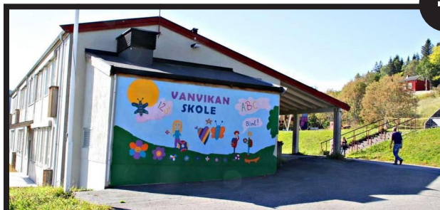
REDDET: Barne- og ungdomsskolen i Vanvikan er foreløpig reddet fra nedleggelse.