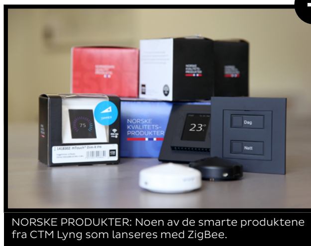
NORSKE PRODUKTER: Noen av de smarte produktene fra CTM Lyng som lanseres med ZigBee.

Dette unike norske samarbeidet mellom to norske teknolibedrifter vil føre til styrket markedsposisjon for begge selskapene både