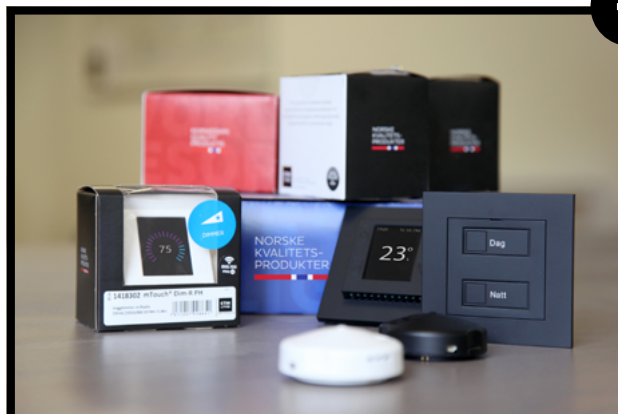
NORSKE PRODUKTER: Noen av de smarte produktene fra CTM Lyng som lanseres med ZigBee.