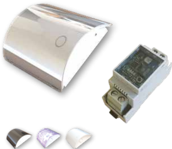
Skins gir valgfritt design/farge